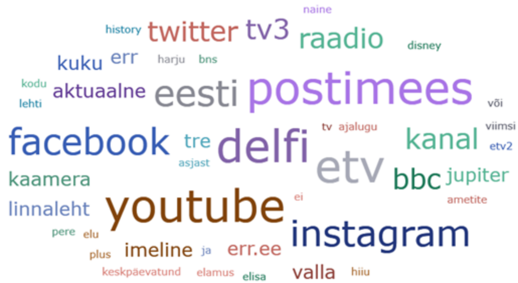
Sõnapilv 1: Enim mainitud kanalid eestikeelsetes gruppides.